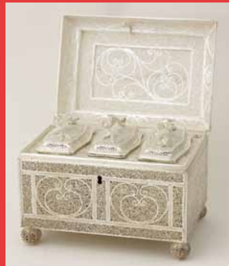
Zilveren theekistje door Hendrik Boshart, 17x17x12,5 cm., 1771. Zeeuws Archief, stadhuiscollectie Middelburg.

Een belegging om mee te pronken, dat was de functie van dit zilveren theekistje. De waarde van het kistje zit 'm in het zilver en in het vakwerk van de maker, de meester zilversmid Hendrik Boshart (1732-1801) uit Middelburg. Hij maakte dit kistje in 1771 in een draadwerk- of filigraantechniek. Ontelbare zilveren draden zijn verwerkt tot een sierlijk symmetrisch motief, dat het theekistje een elegant uiterlijk geeft. Dat wordt nog versterkt door de handgrepen op de deksel en de drie inliggende theebusjes – alle in de vorm van ineengestregelde bloemen. Theedrinken was in de achttiende eeuw een elegante en verfijnde bezigheid en dat heeft Boshart met zijn werk meesterlijk tot uitdrukking gebracht.