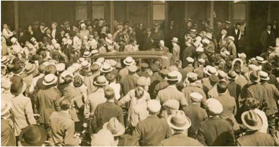
Aankomst van Sjef van Dongen als nationale held in Rotterdam, 14 augustus 1928. Archief Sjef van Dongen, inv.nr 2.