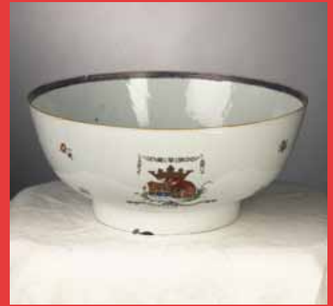
Spoelkom van porselein, diam. 28,5 cm, hoogte 12,5 cm, ca 1789. Zeeuws Archief, Stadhuiscollectie Veere, inv.nr GVR 183.

Soms is familiegeschiedenis af te lezen aan serviesgoed. Chinees porselein was zeer gewild in Europa en miljoenen stuks werden geïmporteerd. Een echt statussymbool was een servies voorzien van het familiewapen. Soms werden de beide familiewapens van een echtpaar verenigd weergegeven in een alliantiewapen. Dit 'Chine-de-commande', porselein op bestelling, bestaat sinds het einde van de zeventiende eeuw.