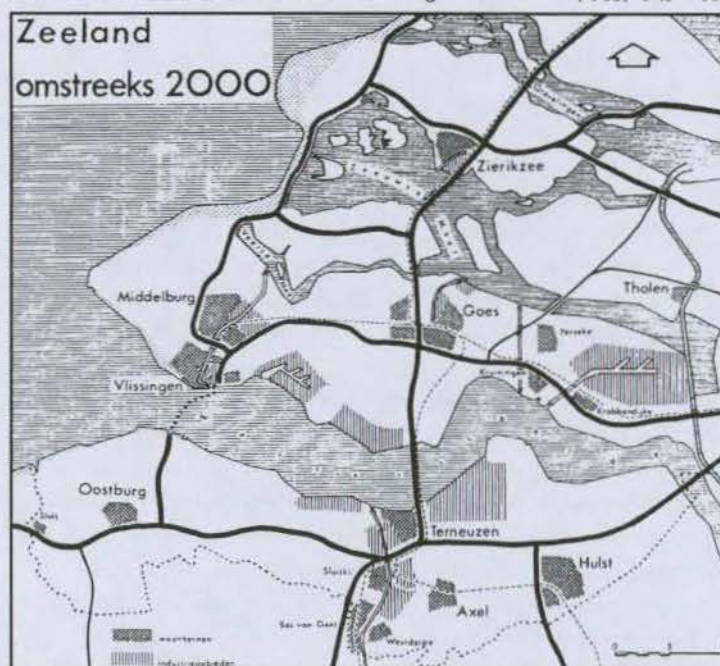
Zeeland zoals de PPD zich dat eind jaren zestig voorstelde. Opvallend zijn de haven- en industriegebieden in Reimerswaal, rond Honnenisse en Ellewoutsdijk, de verbinding over de Westerschelde en ontsluitingswegen dwars over Sint Philipsland en Goeree-Overflakkee.

Archief Provinciale Planologische Dienst (PPD) in Zeeland, (1933) 1943 - 1991, toegang 129.