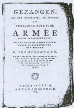
De zangtekst die in 1800 voor het toneelgezelschap in Zierikzee werd gedrukt.