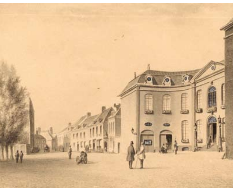
Gewassen pentekening door J.F. Schütz, 17x22 cm., ZI-II-0447. De afbeelding werd in litho gebracht voor 'Twaalfgezichten der stad Middelburg' uitgegeven in 1851.

Het Zeeuws Archief bestaat in 2010 tien jaar. In januari 2000 gingen de deuren van het nieuwe gebouw aan het Hofplein in Middelburg voor het publiek open en in mei werd de fusie tussen de drie deelnemende archiefinstellingen formeel van kracht. In tien jaar is er veel veranderd. Het internet speelde in het eerste decennium een cruciale rol. Tijd voor een 'flashback' en vooral een 'flash forward', want wat heeft de toekomst te bieden?