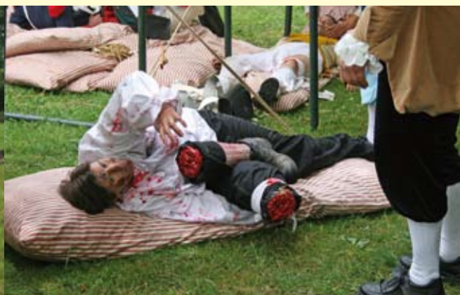
Bivak Walcheren 1809