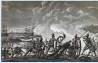
A Landing van de Engelse troepen op het eiland Walcheren en aanval op het fort Den Haak op 31 juli 1809. Aquatint door A. Lutz naar een tekening van J. Jelgerhuis, 31 x 36 cm. ZI-III-0295