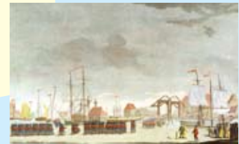
C Intrede van de Engelse troepen in Middelburg in augustus 1809. Proefdruk, ets en gravure door F. Dietrich, met de hand in kleur afgezet, uitgever A. Poncia, Amsterdam. HTAM-H-031

C Middelburg 31 juli 's ochtends De landdrost besluit in Middelburg te blijven