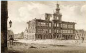
E Het gebombardeerde stadhuis van Vlissingen. Tekening door J.H. Koekkoek (1778-1851), pen en penseel, grijs gewassen, 16 x 25 cm. ZI-II-1243