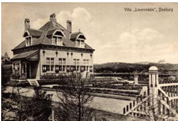
Villa Loverendale in Domburg.