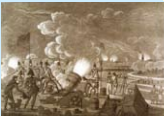
D Bombardement van de stad Vlissingen door de Engelsen vanaflandzijde in augustus 1809. Aquatint, A. Lutz naar een tekening van J. Jelgerhuis, 33 x 36 cm. ZI-III-0297

30 juli, 's middags Landing van Britse troepen bij Breezand