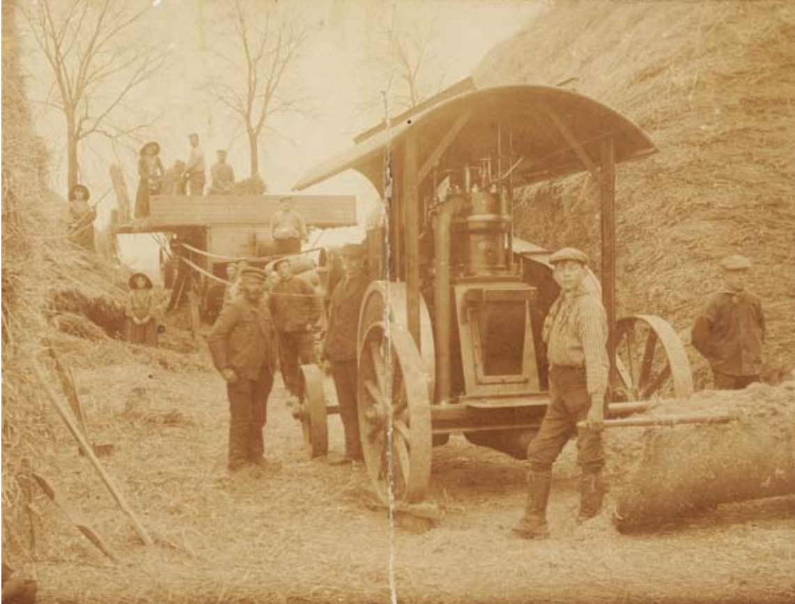
Arbeiders van de Wilhelminapolder dorsen met een dorsmachine aangedreven door een locomobiel, circa 1895-1905.