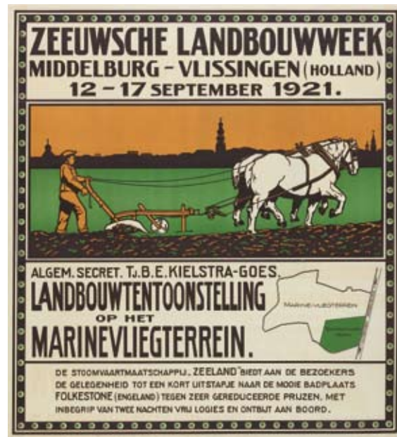
Affiche. Lithografie, 87x79 cm. ZI-III-1053

De nieuwe tentoonstelling in het Zeeuws Archief gaat over de Zeeuwse landbouw in de negentiende en twintigste eeuw. Zeeland is van oudsher een agrarische provincie. Akkerbouw, melkveehouderij en fruitteelt hebben altijd een belangrijke rol gespeeld. Het Zeeuws Archief brengt dit agrarische erfgoed met archiefstukken en oude voorwerpen weer tot leven. De aandacht gaat onder andere uit naar de Koninklijke Maatschap de Wilhelminapolder die dit jaar haar 200-jarig bestaan viert, de Zeeuwse Landbouw Maatschappij (ZLM), en de NV Cultuur Maatschappij Loverendale op Walcheren, een van de eerste biologisch-dynamische landbouwbedrijven ter wereld! Ook komen de 400 jaar oude betrekkingen tussen de Verenigde Staten en Nederland aan de orde. Dankzij de Marshall-hulp werd ook in Zeeland de landbouw verder gemechaniseerd. In het kader van '2009 Jaar van de Tradities' wordt aandacht besteed aan klederdrachten, boerderijen en typisch Zeeuwse landbouwgebruiken. De expositie is te zien van 27 april 2009 tot 8 januari 2010.