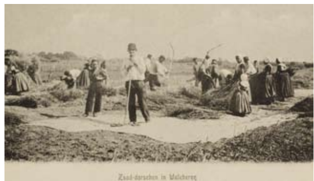
Dorsen met de hand in Biggekerke, ca 1905-1910. HTAM-P-1321

Alle cursussen worden gegeven in het Zeeuws Archief en georganiseerd door het Zeeuws Archief en de Zeeuwse Volksuniversiteit (ZVU). Voor meer informatie: