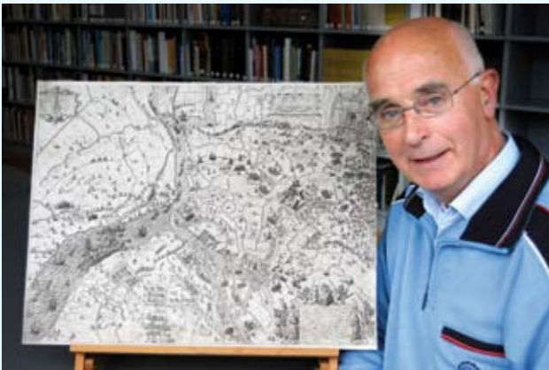
Kaart van Sluis, Cadzand en omliggende polders tijdens het beleg en de verovering van Sluis door prins Maurits, 25 april-19 augustus 1604. Gravure door Floris Balthasarsz. van Berckenrode, zonder jaar. ZI-III nr 117