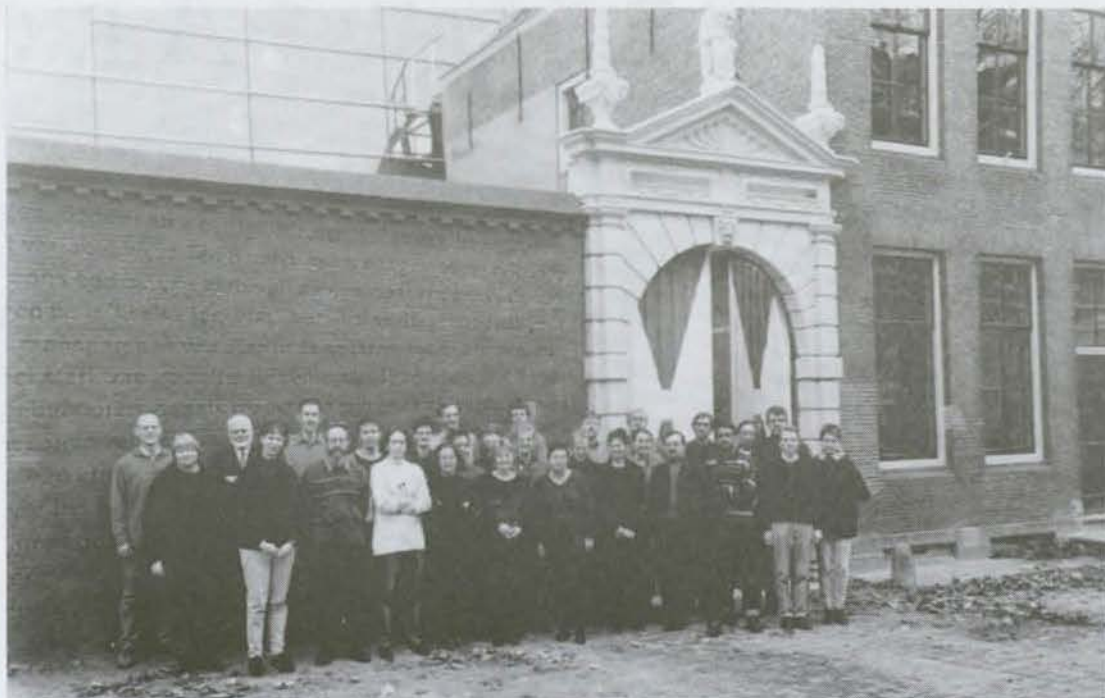
Medewerkers van het archief voor de Brouwerijpoort

De medewerkers van het Zeeuws Archief staan klaar om u te helpen