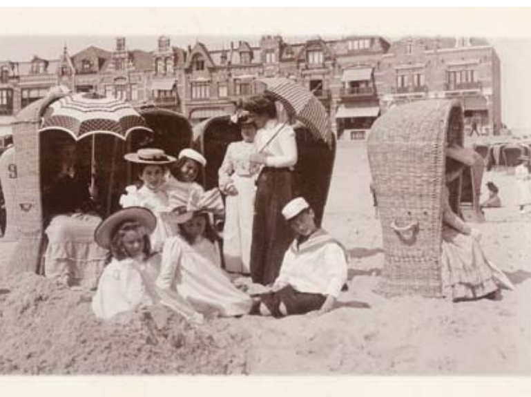
Vreemdelingen op het strand te Vlissingen, circa 1900, Zel.Ill. II-2827.

Archief Houthandel Alberts, toegang 539, Maatschap Alberts & Co ter exploitatie van baden te Zandvoort, inv.nrs 1098 t/m 1105. Kijk voor nieuws over de rechtzaken in de Zeeuwse krantenbank: www.krantenbankzeeland.nl , Zierikzeesche Nieuwsbode van 3 en 27 februari en 30 oktober 1894.