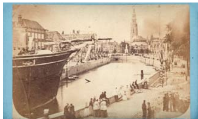
Feestelijke opening van het droogdok te Middelburg op 30 juni 1876. Links het fregat Minister Fransen van de Putte. BG-0380-18

De Middelburgse Commercie Compagnie liet voor de allegorische optocht tijdens de spoorwegfeesten op 9 en 10 juli 1867 een praalwagen bouwen in de vorm van een driemaster. De foto werd gemaakt door J.W. Gerstenhauer Zimmerman die ook de verschillende deelnemers aan de optocht vastlegde in een tekening. Deze verscheen datzelfde jaar in steendruk bij het boekje De Zeeuwsche spoorweg van G.N. de Stoppelaar . Hierin werden de praalwagens uitvoerig beschreven. Zo is de hierbij afgebeelde wagen een 'Amerikaansch center board vessel met driemast-schoonertuig', dat tijdens de optocht werd voortgetrokken door twee paarden met rode pluimen en geel omrande rode dekkleden met een geel anker in het midden. BG-0380-24 (detail)