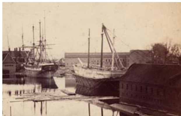
Schepen in reparatie op de werf aan het Balkengat van de in 1720 opgerichte Middelburgse Commerciale Compagnie, 1867-1872. BG-0380-38 (detail). Foto uit het album dat dankzij de Stichting Vrienden kon worden verworven, zie het artikel op de voorpagina.

Zeeuwen op zee: Zeevarenden in archiefbronnen Zeevaart en zeehandel hebben de Zeeuwen in de zestiende tot de achttiende eeuw geen windeieren gelegd. Schepen voeren af en aan om