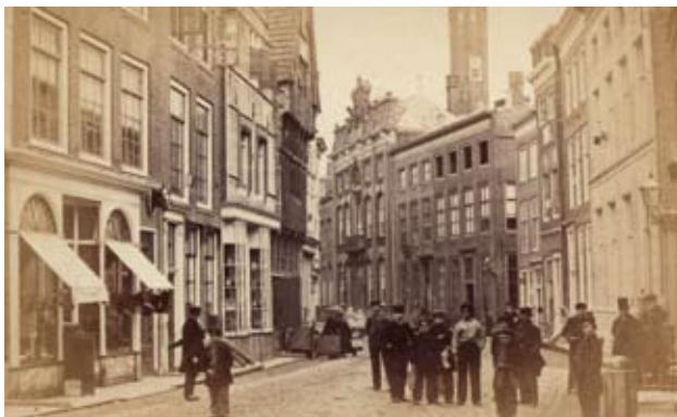
Gezicht op de bedrijvige Lange Delft te Middelburg, met links een schoenenwinkel en verderop de laatste houten gevel nog op de oorspronkelijke plek, 1865-1870. BG-0380-51 (detail). Foto uit het album dat dankzij de Stichting Vrienden kon worden verworven, zie het artikel op de voorpagina.