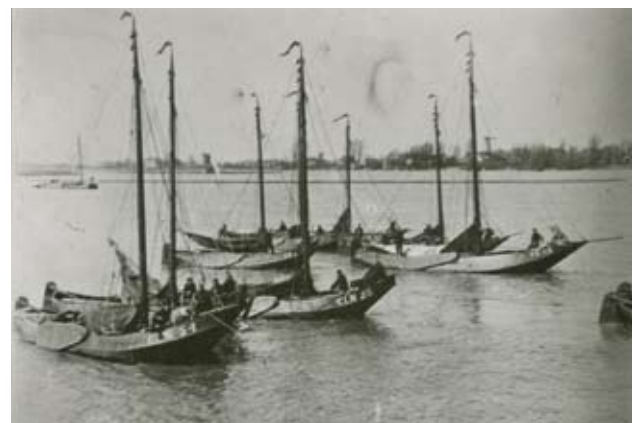
Hoogaarzen en hengsten op stroom voor Dordrecht, met volle ruimen op weg naar de thuishaven. Uiterst rechts de garnalenvisser VE 13.