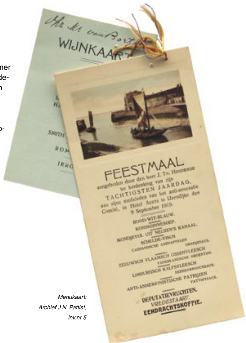
Menukaart: Archief J.N. Pattist, inv.nr 5

Het gaat om een stukje geschiedenis dat niet veel mensen kennen. "Zelfs veel inwoners wisten niet dat België na de Eerste Wereldoorlog (1914-1918) Zeeuws-Vlaanderen opeiste", vertelt Vermeere, zelf een geboren en getogen Zeeuws-Vlaming. Het land had grote oorlogsschade geleden en stelde niet alleen de oorlogvoerende partijen aansprakelijk, maar ook het neutraal gebleven Nederland. "België meende dat de Nederlandse neutraliteit vooral ten gunste was gekomen van Duitsland", verklaart Vermeere. "Bovendien verleende Nederland de Duitse keizer ook nog eens asiel." Naast Zeeuws-Vlaanderen >