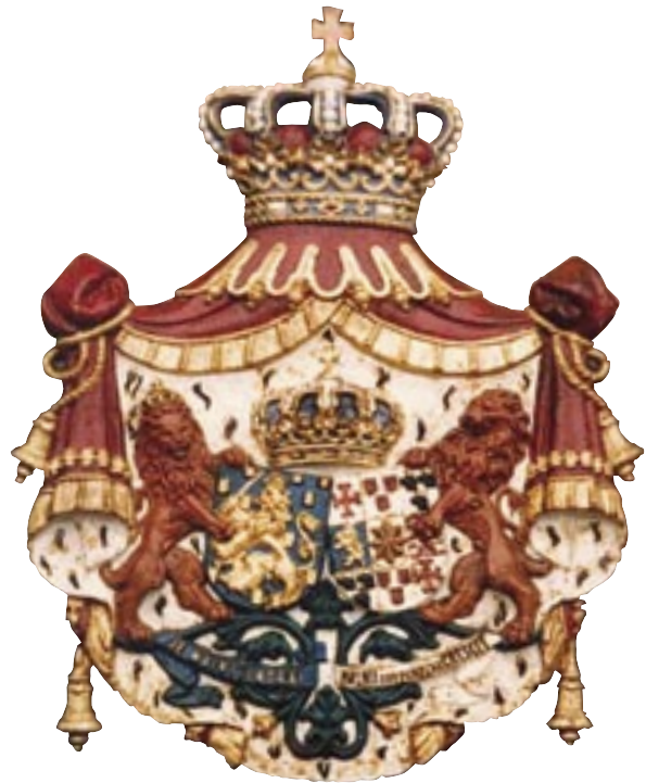
Gietijzeren wapenschild met het wapen van koningin-weduwe Emma dat jarenlang de bakkerszaak van Van 't Westeinde in 's-Heerenhoek sierde. Particuliere collectie.

Over deze en andere hofleveranciers is het nodige te vinden in het archief van Provinciaal Bestuur Zeeland 1851-1910 onder de Kabinetstukken van de Commissaris des Konings, inv.nrs 3854-3913. Lijsten van hofleveranciers in Zeeland bevinden zich in de Verzameling Aanwinsten Zeeuws Archief, inv.nr 127.