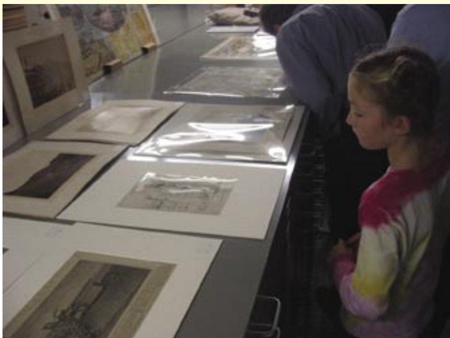
Landelijke Archievendag 29 oktober 2005: de rondleiding voerde bezoekers door de depots langs een selectie van archiefschatten met als thema 'België'.

De historische sensatie van Fasseur Zeeuwse bronnen over België, 175 jaar geleden Hofleveranciers My Generation! Jong + Zeeuws = ? Cursussen in het Zeeuws Archief Adres en openingstijden