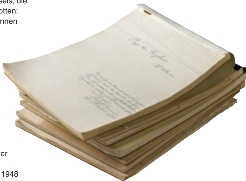
Manuscript van De prijs der vrijheid (6 schrijfblokken), dat werd gepubliceerd in 1948. Het werd als hoorspel door de NCRV uitgezonden in 1950.

Op 14 januari 2004 gaf een neef van Hendrik Sturm het archief van zijn 'oom Eine' in bewaring aan het Zeeuws Archief. Het archief bevat onder andere manuscripten, artikelen uit tijdschriften en kranten en foto's. De inventaris is te raadplegen via www.archieven.nl