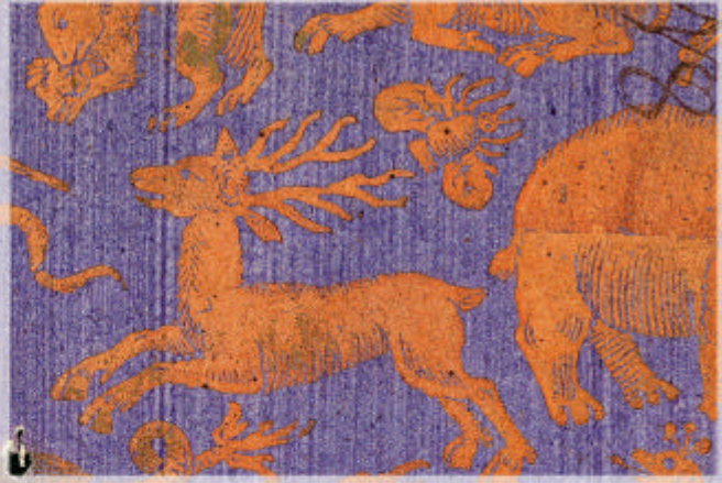
Brokaatpapier met dieren. Archief Rekenkamer van Zeeland, Rekenkamer B, acquitten, inv.nr 8531.

In het archief van de Rekenkamer van Zeeland bevinden zich schriftjes met omslagen van brokaatpapier. De brokaatpapieren zijn gedrukt in goud op gekleurd papier en hebben verschillende voorstellingen, van Romeinse filosofen, bloemen, vogels, fruitmanden, cupido's tot allegorische voorstellingen, sterren en waaierpatronen. De schriftjes zelf bevatten de verpachtingskohieren van de korentienden in de Annapolder op Noord-Beveland (1744-1770).