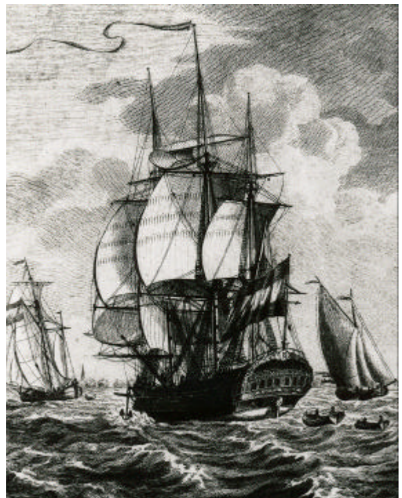
Detail van een prent door M. de Sallieth van het uitzeilen van twee VOC-schepen van de rede van Rammekens, 1781.

Voor elk schip dat vertrok, werd een scheepssoldijboek aangelegd. Deze boeken zijn bewaard gebleven vanaf 1700, en zijn vergelijkbaar met een hedendaagse salarisadministratie. Voor elk bemanningslid werd een dubbele pagina op folioformaat gereserveerd. Daarop staat aangetekend hoe hij heette, waar hij vandaan kwam, welke rang hij aan boord bekleedde, wanneer hij uit dienst ging en waarom, hoeveel hij verdiende, hoeveel daarvan als voorschot was betaald, met welk familielid eventuele schulden en tegoeden konden worden verrekend, enzovoorts. Niet alle informatie is geschikt voor verwerking in een database. Daarom zult u, als u meer wilt weten over een bepaalde persoon, het originele boek moeten raadplegen. Deze originelen bevinden zich in het Nationaal Archief, maar worden daarnaast op microfiche gezet, zodat ze ook bij de archiefdiensten in de VOC-steden kunnen worden geraadpleegd. In de studiezaal van het Zeeuws Archief zijn de microfiches van de Kamers Zeeland, Delft en Rotterdam reeds in te zien. Amsterdam en Enkhuizen-Hoorn volgen. De database met namen van opvarenden wordt de komende tijd aangevuld en is te raadplegen via de website www.voc.mindbus.nl . Het invoeren van de Kamer Zeeland wordt in 2005 voltooid, tot die tijd kunt u ook de indexen inzien die zijn opgenomen in de Verzameling Genealogische Afschriften, in de studiezaal van het Zeeuws Archief.