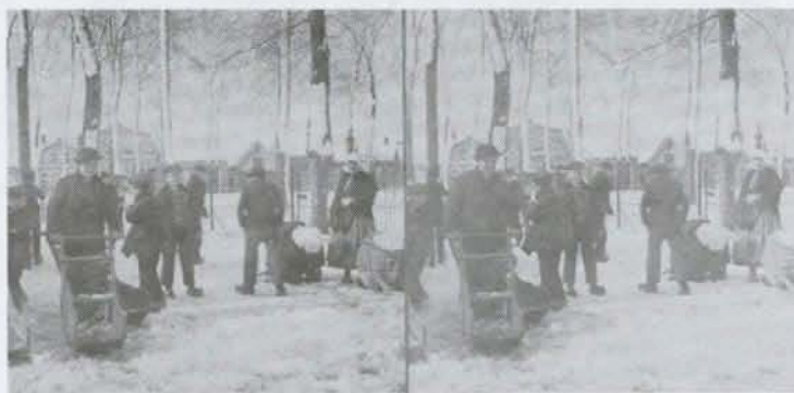
Ijspret in Koudekerke, stereofoto van dr. van der Harst

lectie ligt in het rijksarchief), maar ook Walcherse dorpsgezichten, mooie prentjes van bosbessenpluk op Walcheren, een vliegtuigongeluk in Biggekerke anno 1917, Koninklijk bezoek in 1907, Belgische vluchtelingen in Zeeland anno 1914 en vele andere onderwerpen. Specialiteit van dr. Van der Harst was de zogenaamde 'stereofotografie' waarbij twee identieke foto's in een kijker gestopt worden waardoor een driedimensionaal effect gecreëerd wordt. Dit gedeelte van het archief was lange tijd spoorloos, maar bleek in een verloren hoekje in het archief van Domburg te liggen. Het is onbekend wie het archief destijds geschonken heeft.