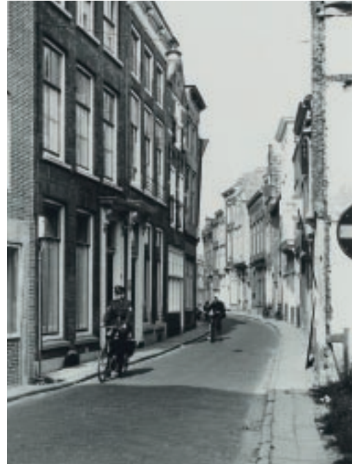
Een verdwenen stadsbeeld; voorheen Lange Giststraat, nu parkeerterrein Damplein in Middelburg. Ca. 1965.

"Wij hebben geprobeerd zo volledig mogelijk te zijn bij het geven van informatie bij elk beeld. Maar het is natuurlijk goed denkbaar dat wij informatie missen of – belangrijker – onjuiste informatie geven. Ik wil graag alle bezoekers van Zeeland in Beeld vragen om als dat het geval is online te reageren. Elke melding wordt door ons gebruikt om de database nog beter te maken. Overigens zijn we heel nieuwsgierig naar de bevindingen van de bezoekers, dus alle reacties worden op prijs gesteld. Namens het Zeeuws Archief, wens ik iedereen heel veel kijkplezier."