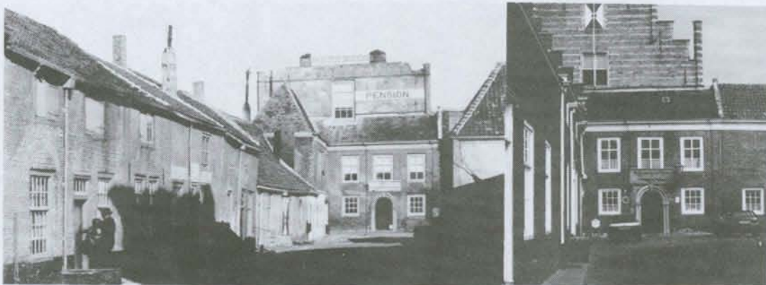
De kaai te Veere met de herberg de Campveerse Toren in 1901 en in 1987.