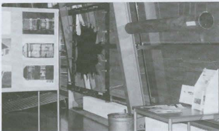
Kleine expositie "Brazielhout, geitenhuid en vakmanschap. De restauratie van een zeventiende-eeuwse Statenband"

De sponsoractie was een groot succes. Veel mensen voelen