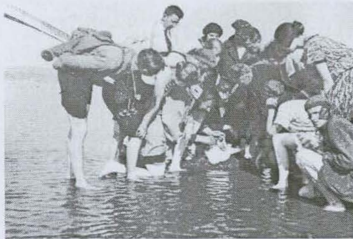
Verzameling Aanwinsten 1955-1990 [toegang 33.3], inv.nr. 1972.12.