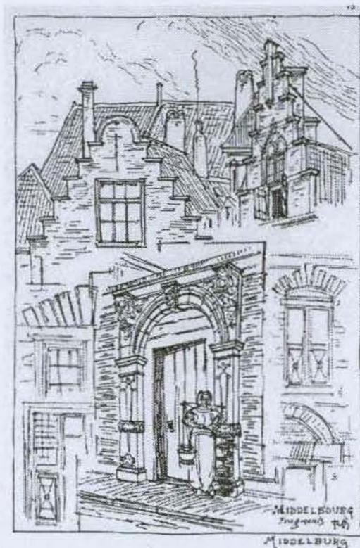
Fragmenten van gevels van huizen in Middelburg. Historisch-topografische atlas gemeente Middelburg, nr. H39.

Vanwege het enorme succes van de cursus 'Wonen in een monumentenpand in de monumentenstad Middelburg', organiseren het Zeeuws Archief, de Stichting Cultureel Erfgoed Zeeland en de Zeeuwse Volksuniversiteit deze cursus nog twee keer, en wel in oktober 2001 en in maart 2002. De cursus omvat zeven lessen van elk twee uur. Tijdens die zeven lessen worden verschillende aspecten van monumentenpanden belicht. Aan de orde komen: de geschiedenis van Middelburg als monumentenpand in vogelvlucht, huizenonderzoek in archieven, bouwgeschiedenis van historische panden, onderhoud en restauratie, monumentale interieurs en een verslag van een bewoner van een monumentenpand van zijn inmiddels voltooide speurtocht naar de historie van zowel gebouw als bewoners en van zijn ervaringen als eigenhandig restaurateur. De cursus in oktober 2001 is op donderdagavond van 19.30-21.30 uur en één zaterdagmorgen. De cursus in maart 2002 is op maandagmiddag van 14.00-16.00 uur en eveneens één zaterdagmorgen. Beide cursussen worden gegeven in het Zeeuws Archief.