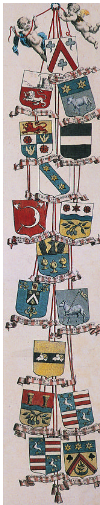
Randversiering Plattegrond van Middelburg door A. Zehender, 1739.

De financiële gegevens hebben betrekking op 2004, en ondergaan elk jaar een kleine aanpassing. Dit informatieblad is een uitgave van de Stichting Vrienden van het Zeeuws Archief en is verschenen als bijlage bij de Nieuwsbrief van maart 2004 van het Zeeuws Archief.