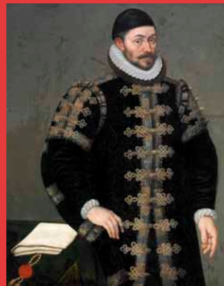
Olieverf op doek, 112x85,5 cm, ca 1588. Stadhuiscollectie Middelburg (Arnhemuiden).

Niet vaak speelt een archiefstuk zo'n prominente rol als op dit schilderij van Willem I, prins van Oranje. De oorkonde met uithangend zegel bevat de stadsrechten die de prins in 1574 aan het dappere Arnemuiden toekende. In tegenstelling tot de stad Middelburg die trouw bleef aan Spanje, had het dorp de kant van de opstandelingen en van Willem van Oranje gekozen.