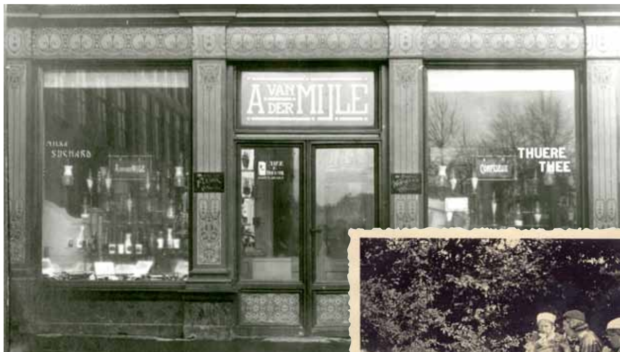
Banketbakkersbedrijf Van der Mijle was gevestigd op de hoek van de Dam en de Korte Delft te Middelburg. Verzameling Beeld en Geluid, toegang aanwinsten 2004.126.

De openbaarheid van de akten van de burgerlijke stand is beperkt. Registers met akten van recente datum kunnen in verband met privacybescherming van levende personen niet worden ingezien. De openbaarheidstermijnen voor akten van geboorte, huwelijk en overlijden zijn respectievelijk 100, 75 en 50 jaar.