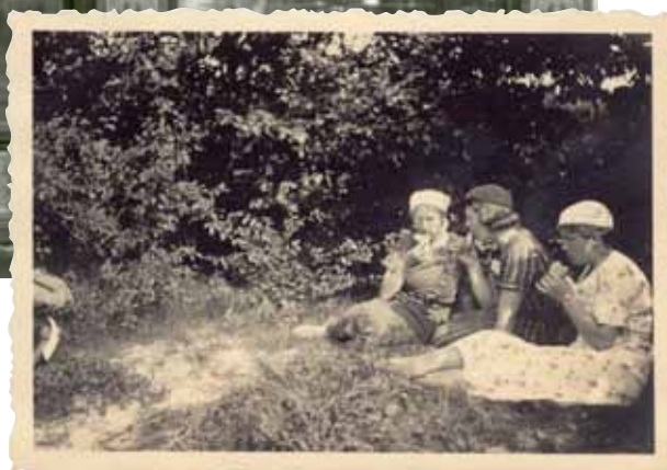
Koek etende dames uit Twente tijdens een fietstochtje langs de kant van de weg op Walcheren, augustus 1936. Verzameling Beeld en Geluid, toegang 300, inv.nr 0414-24.