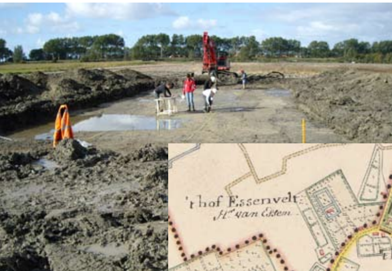
Het hof Essenvelt omstreeks 1750, detail van een kaart uit de Atlas Hattinga, deel 1, nr 23