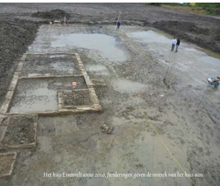
Het huis Essenvelt anno 2010, funderingen geven de omtrek van het huis aan.