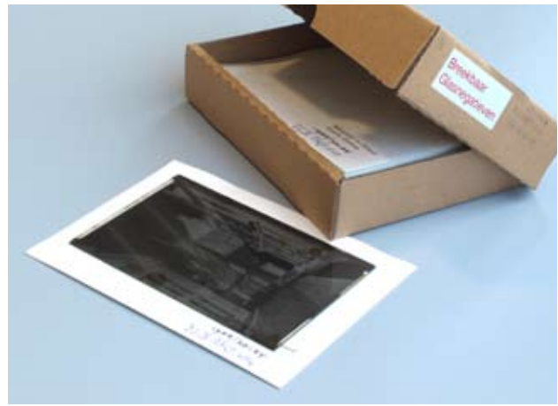
Een archiefdoosje met in Tyvek verpakte glasnegatieven van D.P. Cornelisse.

tabakswaren. Na vier jaar was hij in staat zijn winkel voort te zetten aan de belangrijkste winkelstraat de Korte Delft. De fotograaf maakte veel opnamen van zijn woonplaats; gebouwen en straten, bolwerken en singels, gebeurtenissen, bedrijvigheid aan het Kanaal door Walcheren en schepen. Schepen hadden zijn speciale belangstelling. Vaak ging hij naar Vlissingen, waar hij bij stormachtig weer foto's maakte van de golven die op de boulevards beukten. Buiten Vlissingen en Middelburg legde hij kerken en molens in dorpen en steden in de provincie vast. In de meidagen van 1940 waren het bombardement en de verwoesting van Middelburg het onderwerp. De gevolgen van de inundatie van Walcheren voor Middelburg buiten de vesten bracht hij van november 1944 tot en met oktober 1945 indringend in beeld. Cornelisse gaf een deel van zijn foto's in eigen beheer uit als prentbriefkaart. Daarnaast verkocht hij foto's aan de firma F.B. den Boer in Middelburg die er ook ansichten van uitgaf. Dankzij de vondst van de negatieven kan nu van een groot aantal prentbriefkaarten de herkomst herleid worden. De verzameling negatieven, bestaande uit glasnegatieven en 35mm negatieven op rol (acetaat-cellulose), is de afgelopen jaren geconserveerd en gescand. De glasnegatieven, die helaas