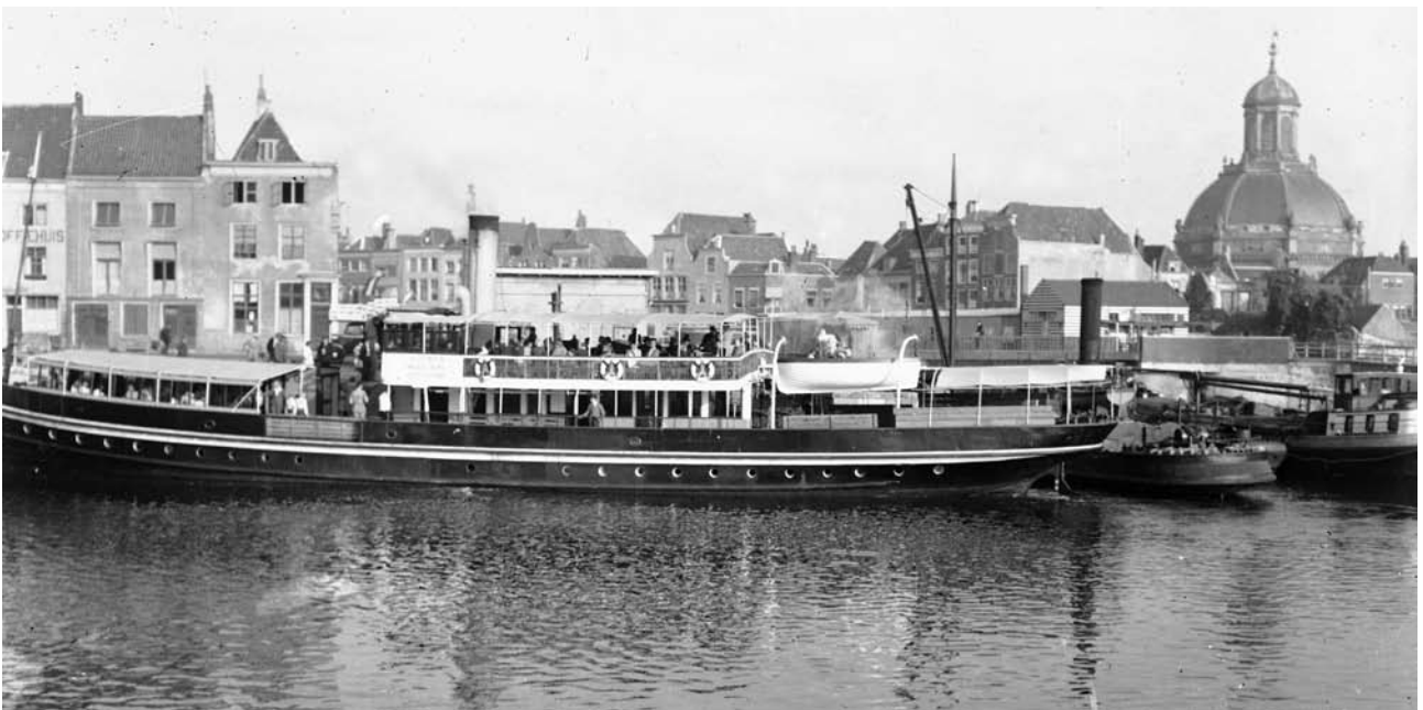
S.S. Koningin Wilhelmina, dienst Middelburg-Rotterdam v.v., aan de Rouaansekaai te Middelburg, 1946. Het schip was eigendom van de Zeeuwsche Stoomboot Mij te Rotterdam die adverteerde onder de naam Middelburgsche Maatschappij van Stoomvaart. Foto: D.P. Cornelisse, ZI-II-2347-233.

Cornelisse werd geboren in Goes en was zoon van een koetsier/pakhuisknecht. Het gezin verhuisde naar Middelburg waar Dignus Pieter Cornelisse vanaf 1916 de kost verdiende als kruideniersbediende. In 1924 vestigde hij zich als fotograaf in de Nederstraat. In zijn winkel verkocht hij fotomaterialen en