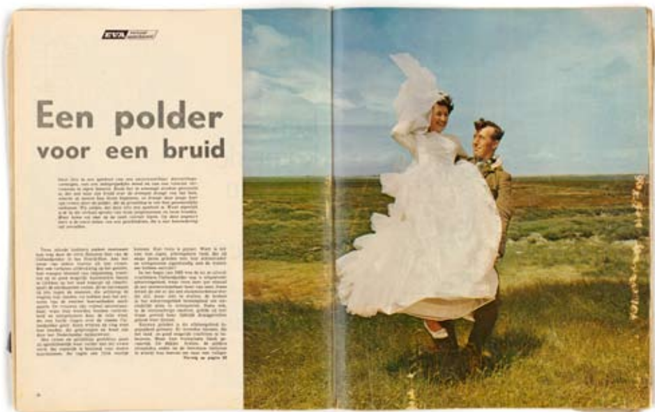
'Een polder voor een bruid', kopte het weekblad Eva, het rijk der vrouw, in november 1963.