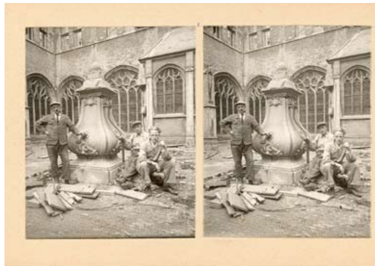
Stereofoto uit de serie van fotograaf Corneel Pieter Sniijders over het puinruimen na het bombardement van Middelburg op 17 mei 1940. Werklieden bij de pomp op het Muntplein in de Abdij. Verzameling Beeld en Geluid, toegang 300, inv.nr 131-33.

kerij Van Straaten in Middelburg, uitgever van bijvoorbeeld prentbriefkaarten. Hij gebruikte zijn vakkennis echter ook voor malafide praktijken; in 1920 werd hij veroordeeld voor valsemunterij. Lees meer over de vervalsingen en zijn ontmaskering op www.zeeuwsarchief.nl . De expositie is te zien t/m vrijdag 7 januari 2011 in het Zeeuws Archief.