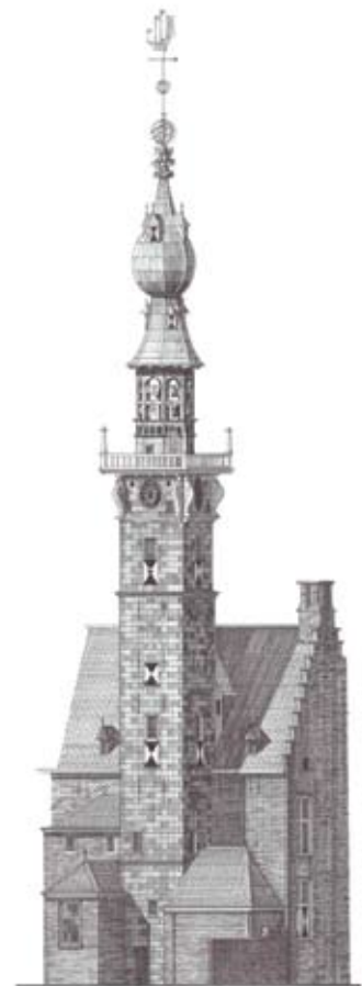
Oude stadhuis te Veere, tekening J. van Bijlevelt.