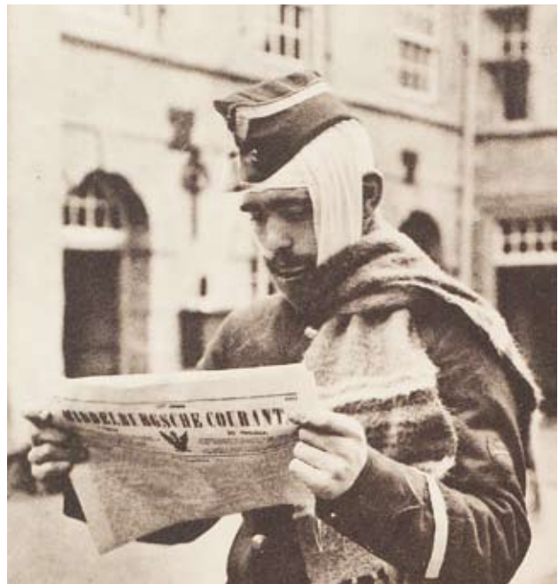
De krant was ooit veruit de belangrijkste nieuwsbron. Een gewonde Belgische militair, opgenomen in het hospitaal in Middelburg, leest het laatste nieuws over de Eerste Wereldoorlog, 1914-1918. ZI-P-03690.

Medewerkers doen vanaf hun werkplek verslag. Ga naar zeeuwegezocht.blogspot.com of zeeuwsarchief.blogspot.com .