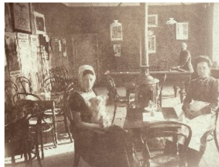
In een uitspanning te Domburg.

Belangstellenden kunnen een account aanmaken