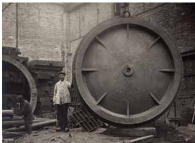
Ijzergieterij Boddaert, Middelburg. Toegang in bewerking.