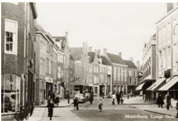
De nieuwe stad. De Lange Delft, vanaf de Segeerstraat richting de Markt, 1950-1955, HTAM-P-0471.

De verwoeste stad, de tijdelijke stad en de nieuwe stad. In deze drie gedaanten is Middelburg het onderwerp van de expositie over de Tweede Wereldoorlog in het Zeeuws Archief. De expositie gaat maandag 17 mei open, en maakt deel uit van het herdenkingsprogramma Het Vergeten Bombardement.