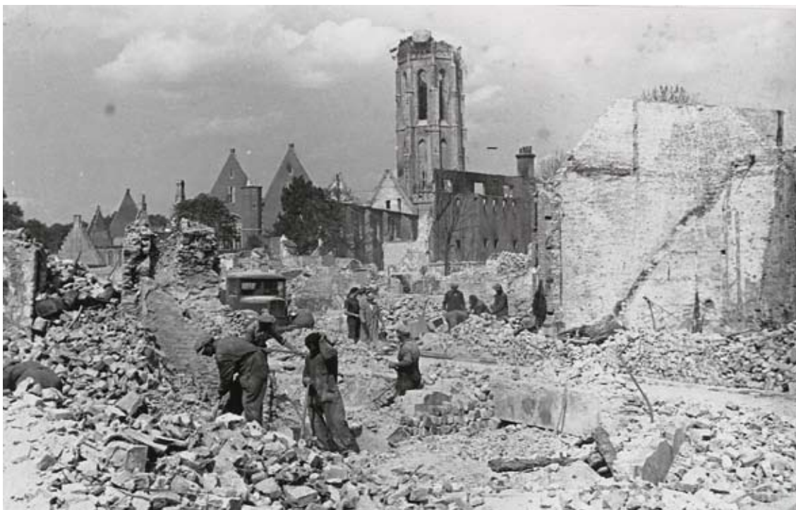
De verwoeste stad. Zicht vanaf de Burg op de Abdijskerk te Middelburg, na het bombardement op 17 mei 1940, HTAM-B-1285III.