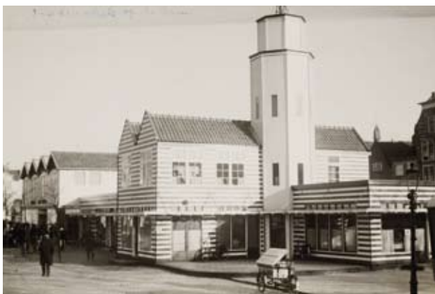
De tijdelijke stad. Noodwinkels aan de Dam te Middelburg, 1940-1941, HTAM-P-1523.