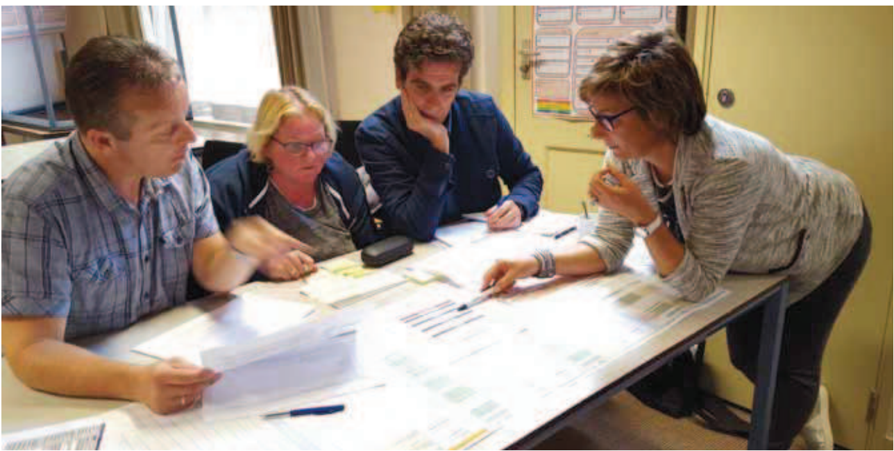
Werken met TML0, workshop van de Zeeuwse werkgroep, 6 oktober 2016.

>> worden bestempeld. Onder hen het e-Depot van het Zeeuws Archief.