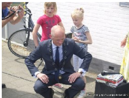
Burgemeester Van der Zwaag van Veere krijgt gerecyclede ambtsketen omgehangen door twee meisjes van de Goede Polderschool

Begin juni 2015, tijdens de Kunst- en Cultuur Driedaagse in Vrouwenpolder met het thema 'hergebruik', kreeg de burgemeester van Veere een gerecyclede ambtsketen omgehangen door twee meisjes van de Goede Polderschool. Deze keten van beeldend kunstenaar Wytse Zwetsloot werd gemaakt van oude fietsbanden van de plaatselijke fietsmaker en van geoxideerde zeilringen die ze vond bij Neeltje Jans. De ketting heeft dertien ringen die staan voor de dertien woonkernen in de gemeente Veere. Ook deze moderne ambtsketen is in de tentoonstelling te zien, net als haar ontwerp voor een "mogelijk nieuwe" ambtsketen.